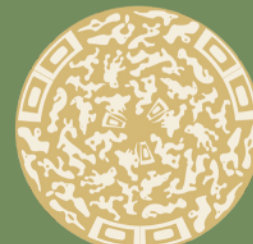
Förenkling och formfantasi nutida tidsdokument