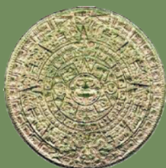
Inspiration från Maya dåtida tidsdokument

"With old native american image culture in South and Central America as an inspiration I have used the modern QR-code as a starting point, containing information from our time."